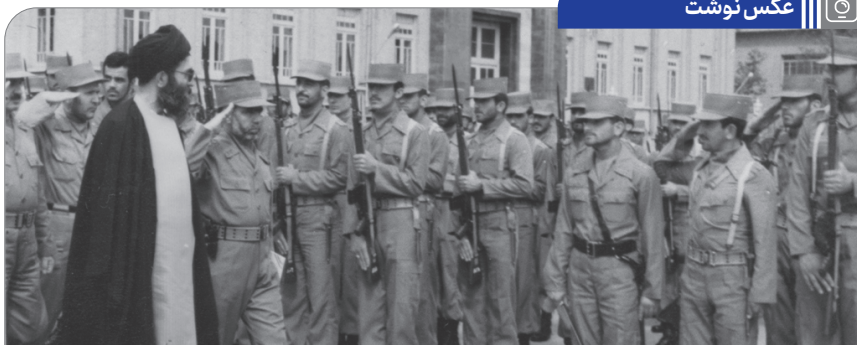
تصویری از حضور آیت الله خامنه‌ای در مراسم دانش آموزی دانشجویان افسری ارتش جمهوری اسلامی ایران